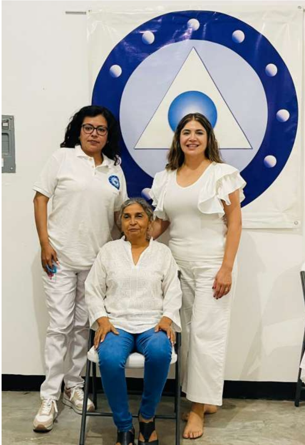
Las hermanas Orden en las Ideas La Pm y Vuelve La Pm, después de recibir la iniciación de Primer Nivel y Segundo Nivel, respectivamente, por parte de la priora Síntesis La Pm, en el Muulasterio Tseyor los Máak de Mazatlán