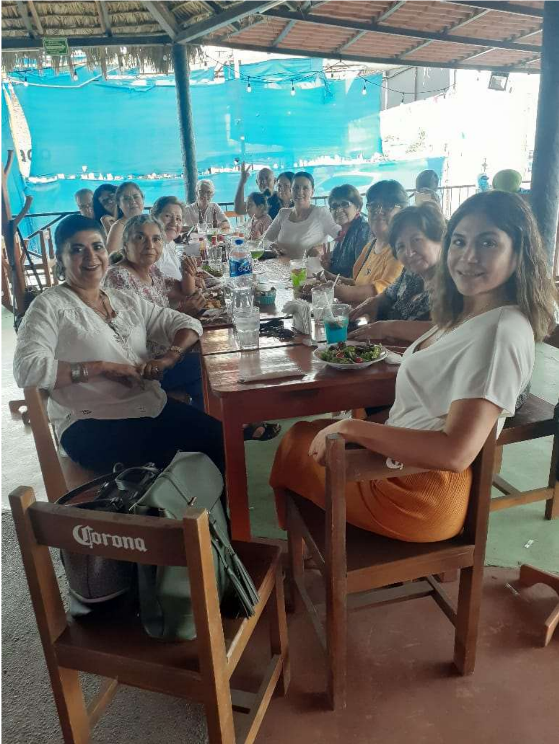
Comida de hermandad de todos los asistentes al Retiro