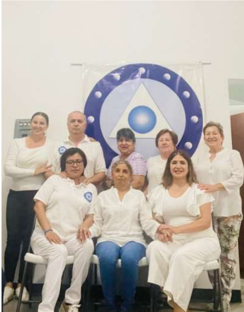
La Priora Síntesis La Pm con las dos iniciadas y sus acompañantes