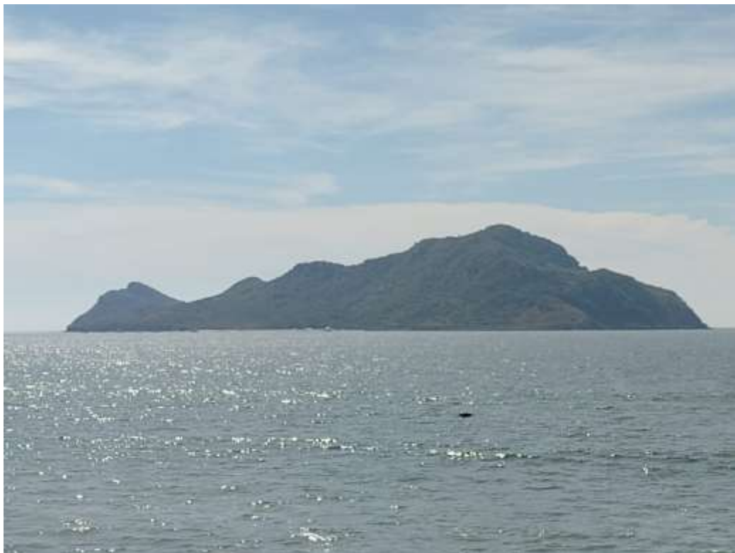
Isla de Venados. Mazatlán-México. En donde se halla ubicada la base submarina extraterrestre de Mazatlán.