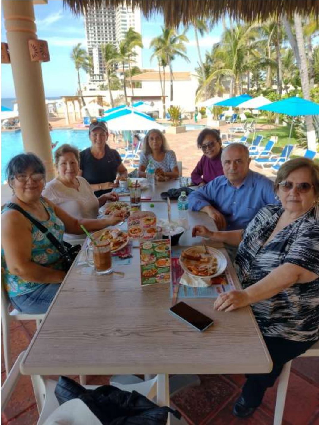
Sublime Decisión Pm, Amando La Pm, Claire La Pm, Síntesis La Pm, Orden en la ideas La Pm, Patrón Marino La Pm y Siempre Hay, almorzando en el malecón de Mazatlán.