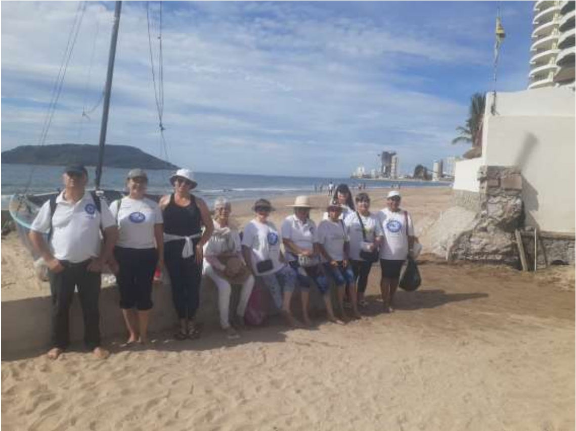
Frente a la Isla de Venados